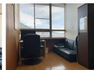
待機室（個室 / オプション）