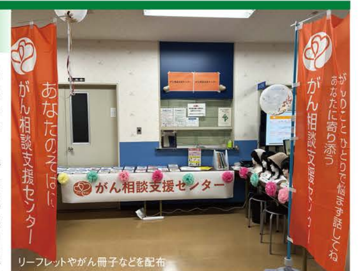
リーフレットやがん冊子などを配布