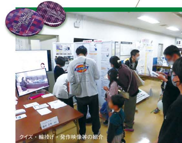
クイズ・輪投げ・発作映像等の紹介

5/11(日)に開催された「すまいるフェスタ」に患者支援連携センター・がん相談支援センターが参加しました。