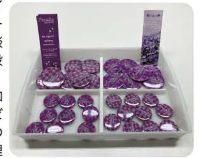
輪投げ参加者にパープルデー缶バッジを配布

当日はお子さんをはじめ、様々な年代の方々(111名)がクイズや輪投げに参加されました。参加者からは「てんかんのことがよく分かりました。」「運転の制限など知らないことが多かったです。」等の声をいただき、てんかんに関する情報や当院の役割等を発信できたと感じております。今後とも、当てんかんセンターに対するご理解とご協力をよろしくお願いいたします。