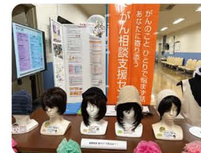
医療用ウィッグやケア帽子等の展示や試着

今回のすまいるフェスタでは、「相談・心理検査ブース」でがん相談支援センターをより多くの方に知ってもらうためにリーフレットなどを配布し紹介しました。県や防府市の補助金制度のあるアピアランスケア(ウィッグや補正下着)の展示や試着もおこないました。当日は、がん患者サロンレモンガラスのぴあサポーターの方々と一緒に広報することができました。「こういう窓口があることを知らなかったのを知れてよかった。」という感想をいただき、今後も様々な方に知っていただけるように活動していきたいと思ひます。