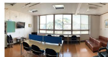
待機室（総室 / 基本）

検査の種類や料金等、詳細は当院ホームページをご覧ください。受診を希望される方は、ぜひお申し込みください。