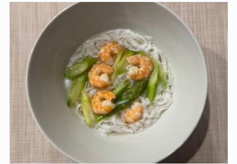
『海老とアスパラガスのフォー』