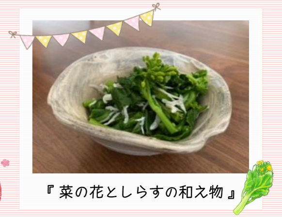
『菜の花としらすの和え物』

菜の花は妊婦さんに積極的に摂ってもらいたい葉酸を豊富に含みます。しらすを使うことでカルシウムを摂取することができます。