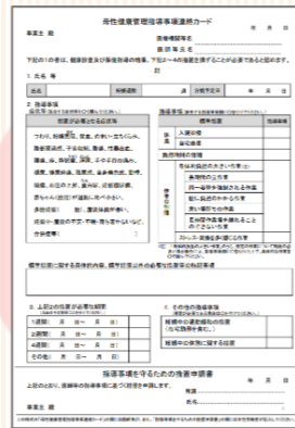
【母性健康管理指導事項連絡カード】