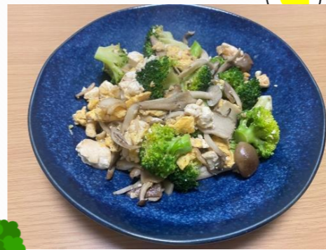
『ブロッコリーと卵の炒め物』