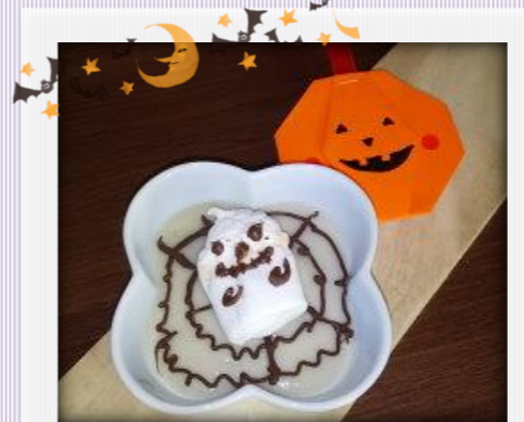
『簡単！焼き芋でババロア』