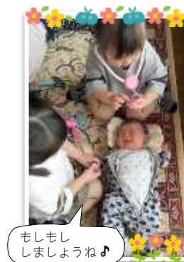
もしもし しましよね!

【ご主人】 待望の男の子ということで、とても楽しみにしていて、無事に生まれてきてくれて喜んでいました。